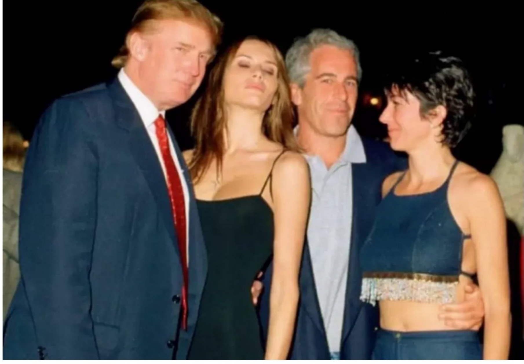
Trump, Epstein y sus respectivas parejas.

Ambos comenzaron pagándole a sus víctimas -que tenían entre 13 y 15 años- 200 dólares por "masajes" (allí abusaban de ellas). También les abonaban la misma suma de dinero a las jóvenes por cada menor que reclutaran y llevaran a su casa de Palm beach para los mismos fines. En 2019, el juez Richard Berman se basó en el testimonio de dos de las presuntas víctimas para ordenar la detención del magnate. Lo hizo por considerarlo un potencial peligro para el público.