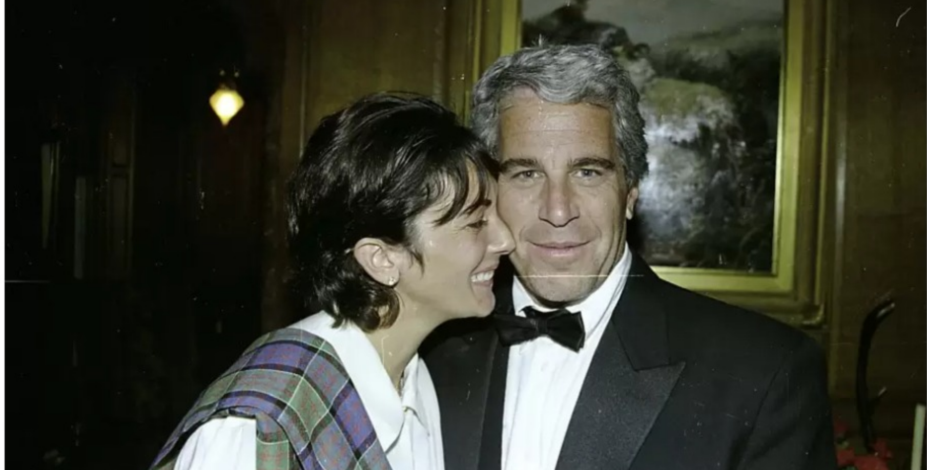
Jeffrey Epstein y Maxwell, su amante

El 23 de julio, tres semanas antes, Epstein había sido encontrado inconsciente y con lesiones en el cuello en su celda de la cárcel. Después de aquel incidente, fue puesto en vigilancia de suicidio. Seis días más tarde, el 29 de julio, fue sacado de la unidad de suicidio y colocado en una unidad de vivienda con otro recluso. La cárcel informó al Departamento de Justicia que Epstein tenía un compañero de celda y que un guardia miraba dentro de la celda cada 30 minutos.