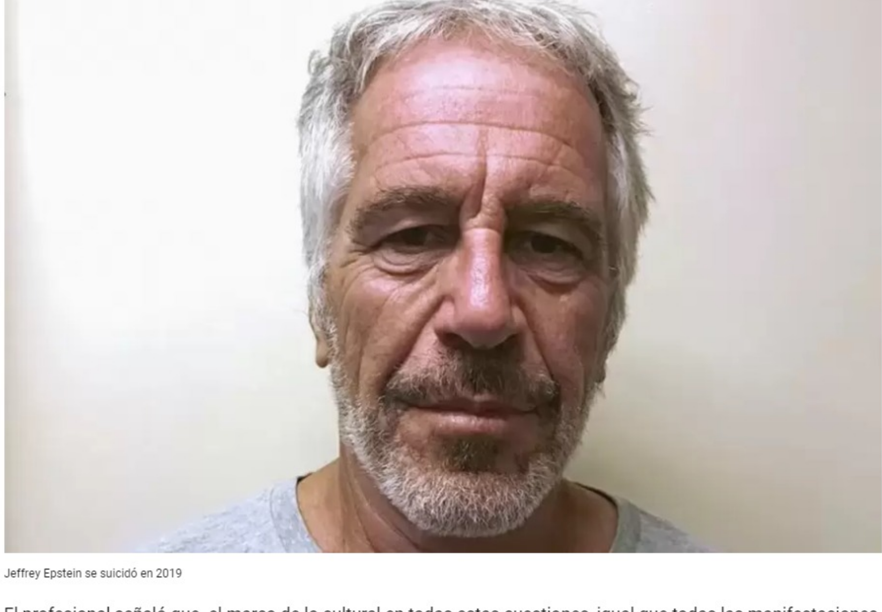
Jeffrey Epstein se suicidó en 2019

Y continuó: "La categoría pedofilia en el ámbito de la psicopatología, de la psiquiatría, la van llevando cada vez más a una elección normal. El último manual de clasificación DSM-5 y el DSM-4 modificado (Manual Diagnóstico y Estadístico de los trastornos mentales) te muestra cómo buscaron lo que fuese una perversión, se esté transformando en el siguiente DSM-5, que es muy factible que la pedofilia no figure como una alteración en el objeto de deseo".