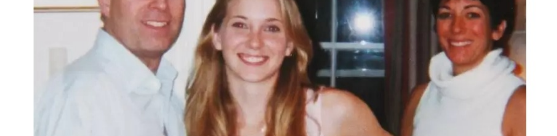
El príncipe Andrés con Virginia Giuffre y Ghislaine Maxwell en 2001.

Y ejemplificó: "A algunas modelos se les presentan sujetos importantes, sujetos con poder, y el gran tema es que esos tipos ejercen el poder, son conscientes del poder, y básicamente gozan, el goce es de la impunidad del poder. El factor excitatorio es el desbalance del poder, es como si yo dijese "bueno, tengo un perrito chiquitito que no me va a morder y gozo lastimándolo. ¿Haría lo mismo con un dóberman? y es factible que no. Esa ecuación entre desbalance de poder, no es solamente lo que posibilita el hecho, sino lo que le agrega goce.