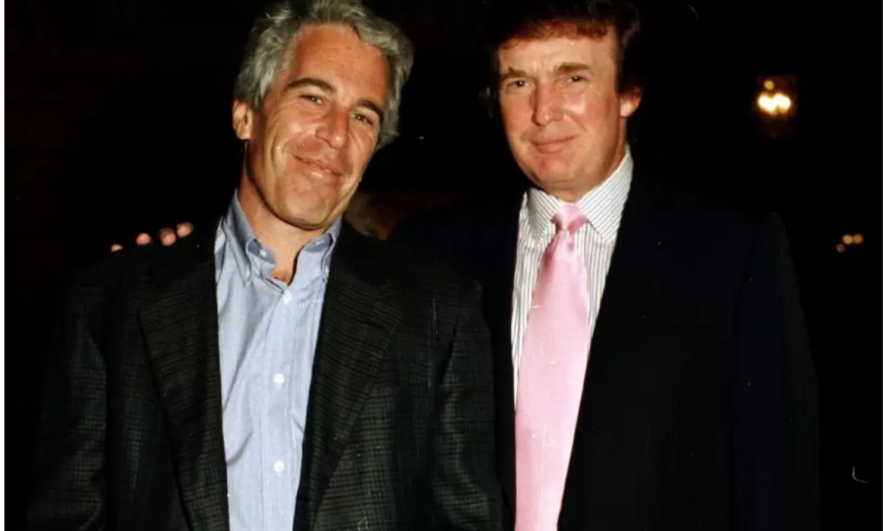
Epstein junto a su amigo, Donald Trump

De acuerdo con De Rosa, el tema se fue transformando mucho más "en un tema social, en cómo ha evolucionado para mal en nuestras sociedades en el mundo, en que la pedofilia ocupa otro lugar". "Vos tenés, por supuesto, obviamente, una estructura del sujeto que participa. Si bien está compuesto por una serie de individualidades, te denota una estructura colectiva. Obviamente, el sujeto que entra en esto, lo que la gente diría, normal no es", remarcó.