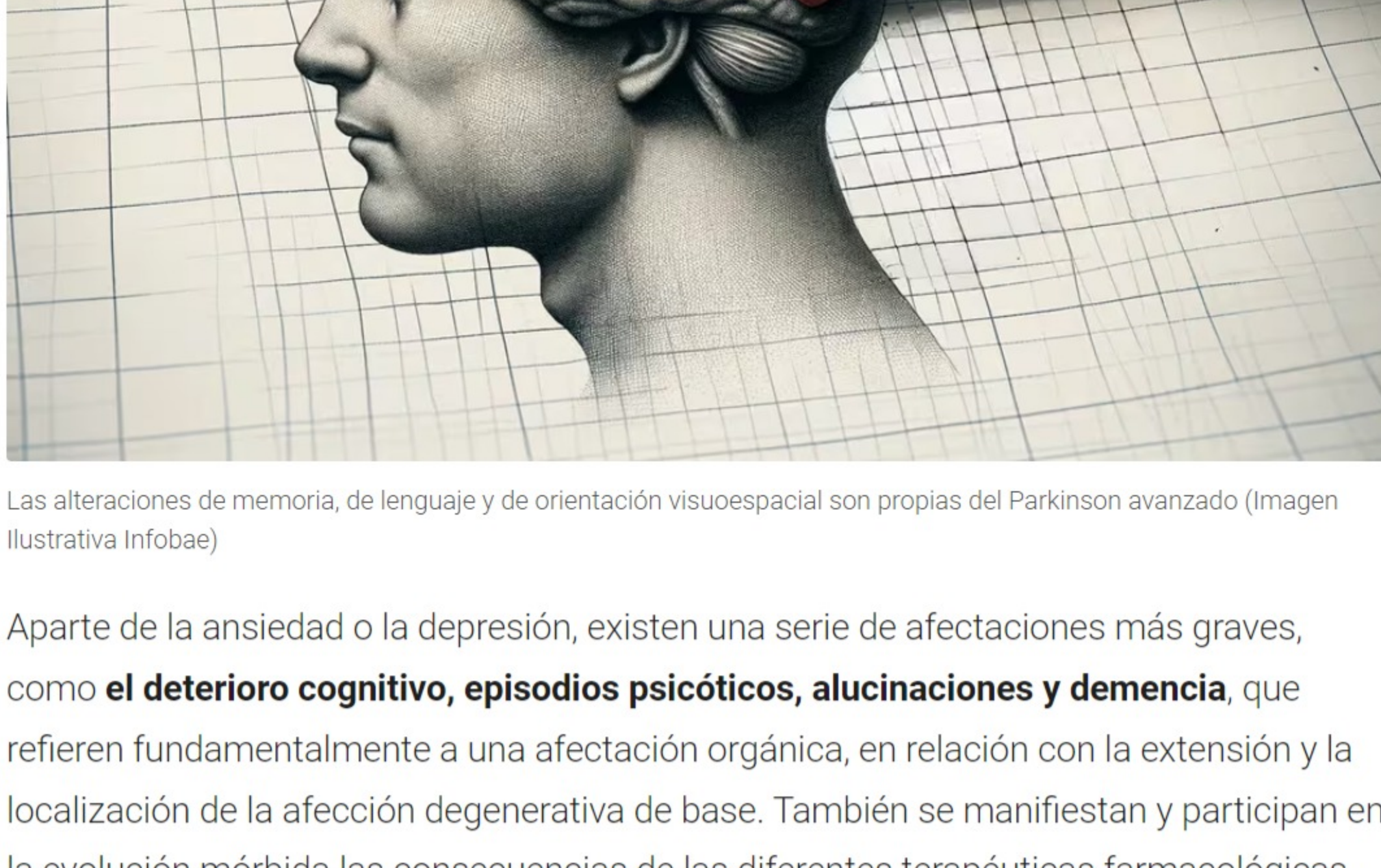
Las alteraciones de memoria, de lenguaje y de orientación visuoespacial son propias del Parkinson avanzado

Aparte de la ansiedad o la depresión, existen una serie de afectaciones más graves, como el deterioro cognitivo, episodios psicóticos, alucinaciones y demencia , que refieren fundamentalmente a una afectación orgánica, en relación con la extensión y la localización de la afectación degenerativa de base. También se manifiestan y participan en la evolución mórbida las consecuencias de las diferentes terapéuticas farmacológicas.