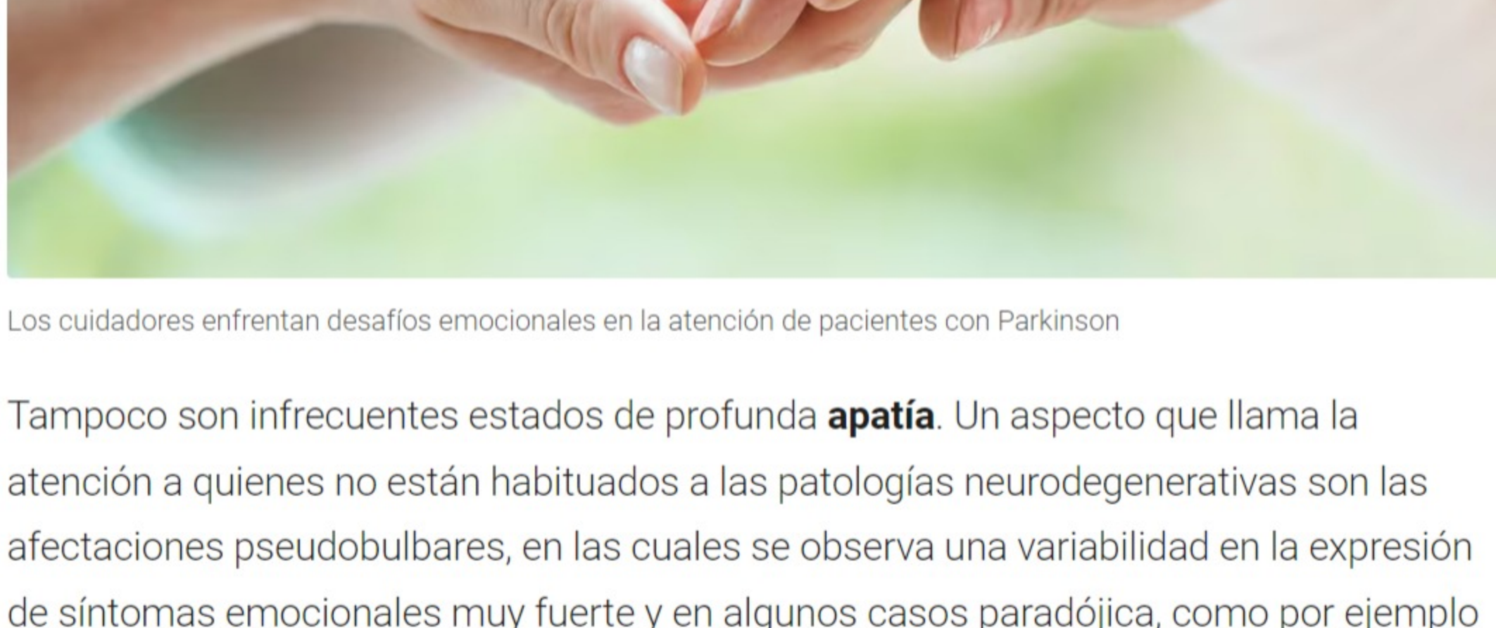
Los cuidadores enfrentan desafíos emocionales en la atención de pacientes con Parkinson

Otras áreas de importancia son aquellas ligadas al control de los impulsos , algunos directamente relacionados con la patología motora y otros en relación a su componente psiquiátrico. Esta impulsividad o deficiente control de los impulsos, puede poner en riesgo a los pacientes de este tipo de afecciones .