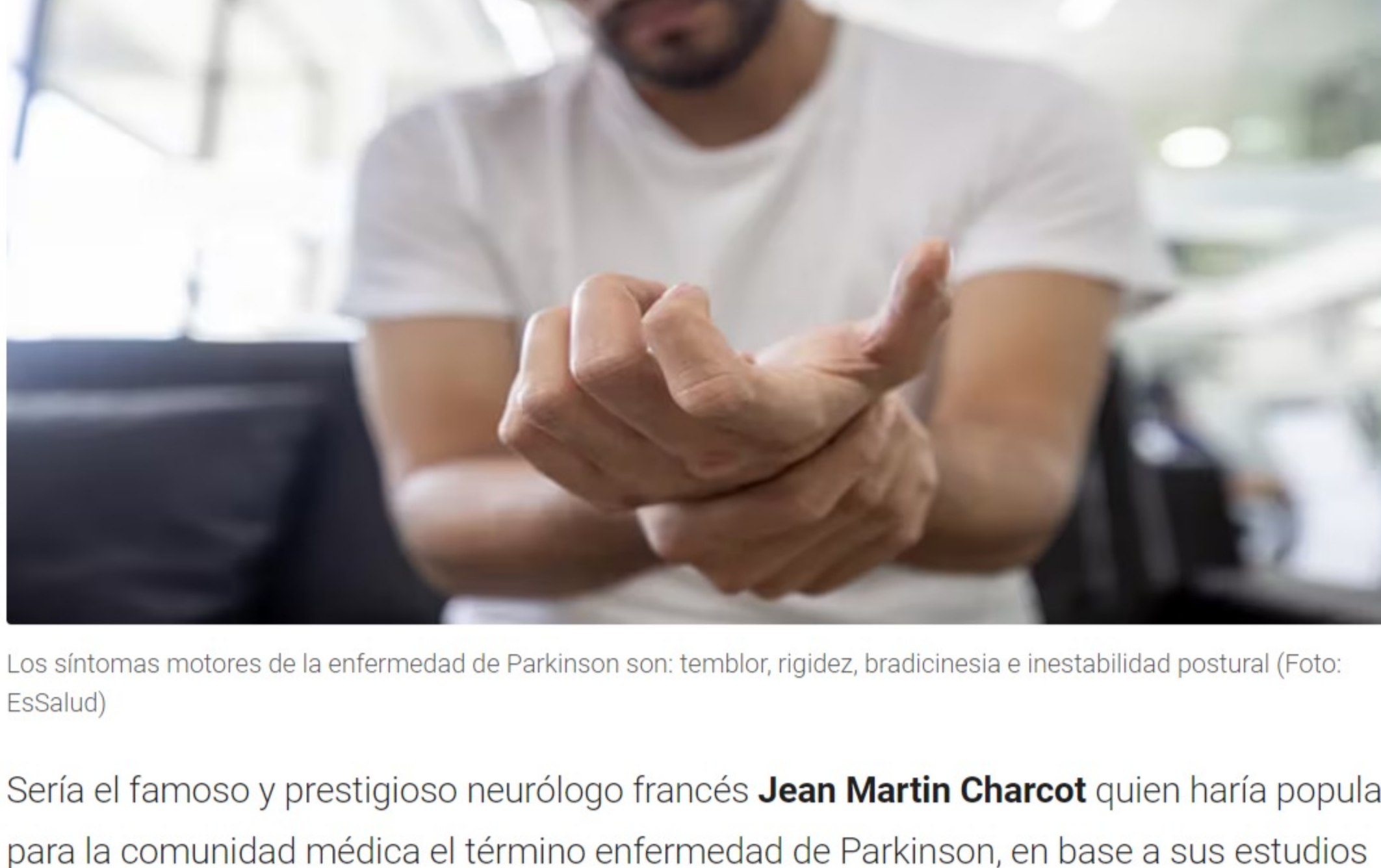
Los síntomas motores de la enfermedad de Parkinson son: temblor, rigidez, bradicinesia e inestabilidad postural

Sería el famoso y prestigioso neurólogo francés Jean Martin Charcot quien haría popular para la comunidad médica el término enfermedad de Parkinson, en base a sus estudios en mayor profundidad de la enfermedad.