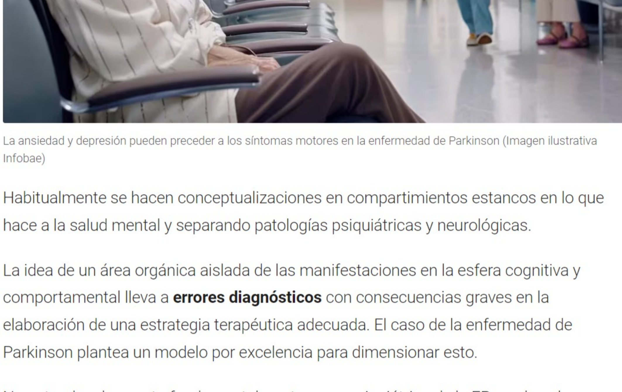
La ansiedad y depresión pueden preceder a los síntomas motores en la enfermedad de Parkinson

Los cuidadores de personas con EP pueden sufrir una gran carga por la demanda de cuidado y un deterioro de su salud mental, con las consecuencias del conocido burnout, ( Síndrome de burnout: cómo desactivarlo y evitar el desgaste emocional en el ámbito laboral ), lo que requiere intervenciones específicas y sistemas de apoyo.