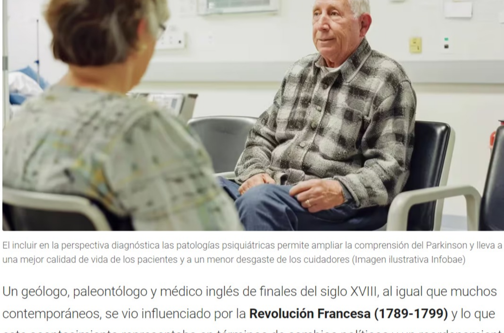
El incluir en la perspectiva diagnóstica las patologías psiquiátricas permite ampliar la comprensión del Parkinson y lleva a una mejor calidad de vida de los pacientes y a un menor desgaste de los cuidadores (Imagen ilustrativa Infobae)

Un geólogo, paleontólogo y médico inglés de finales del siglo XVIII, al igual que muchos contemporáneos, se vio influenciado por la Revolución Francesa (1789-1799) y lo que este acontecimiento representaba en términos de cambios políticos y un reordenamiento social. Este último promovía la consideración de las clases previamente ignoradas por la monarquía como ciudadanos y publicó varios artículos con pedidos de reforma sociales haciendo eje en la salud pública.